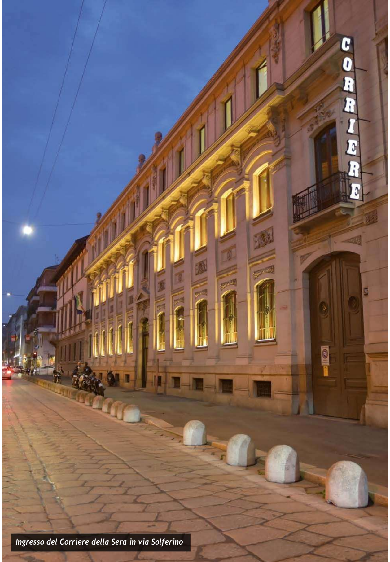
Ingresso del Corriere della Sera in via Solferino