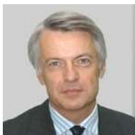
Ferruccio de Bortoli

Editorialista Corriere della Sera Presidente Fondazione Corriere